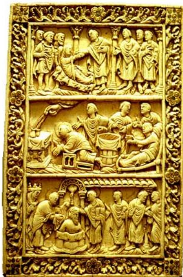
«Τὰ θαύματα τοῦ Ἁγίου Ρεμίου». Ἐπίχρσο ἐλεφαντοστοῦν (880). Le Musée de Picardie, Ἀμιένη.

Ὅταν ὁ Χλοδοβίκος ἀντιμετώπιζε τοὺς Ἀλαμανοὺς στὴν μάχη τοῦ Τολμπιάκ καὶ οἱ στρατιῶτες του ὑποχωροῦσαν, στράφηκε πρὸς τὸν Θεὸ τῆς Κλοτίλδης καὶ τοῦ Ρεμίου καὶ κατάφερε νίκη λαμπρὰ ἐπὶ τοῦ ἐχθροῦ.