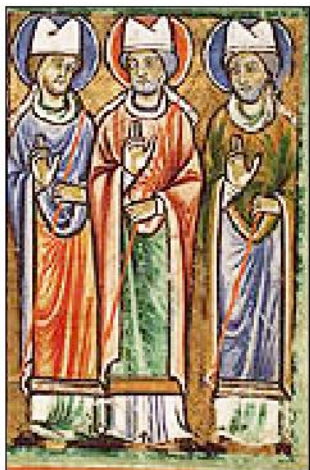
Ὁ Ἅγιος Ρεμίγιος καὶ δύο ἄλλοι Ἱεράρχαι. Μικρογραφία.

ὑπὸ τὴν πνευματικὴν πλέον καθοδήγησι τοῦ Ἁγίου Ρεμιγίου, ὁ Χλοδοβίκος, ὁ νέος αὐτὸς Μέγας Κωνσταντῖνος, ἐξακολούθησε νὰ συνενώνῃ τοὺς βαρβαρικοὺς καὶ γαλλο-ρωμαϊκοὺς πληθυσμοὺς τῆς Γαλατίας καὶ νὰ καθιστᾷ τὸν λαὸ τοῦ κοινωνὸ τῆς ἀληθινῆς Πίστεως.