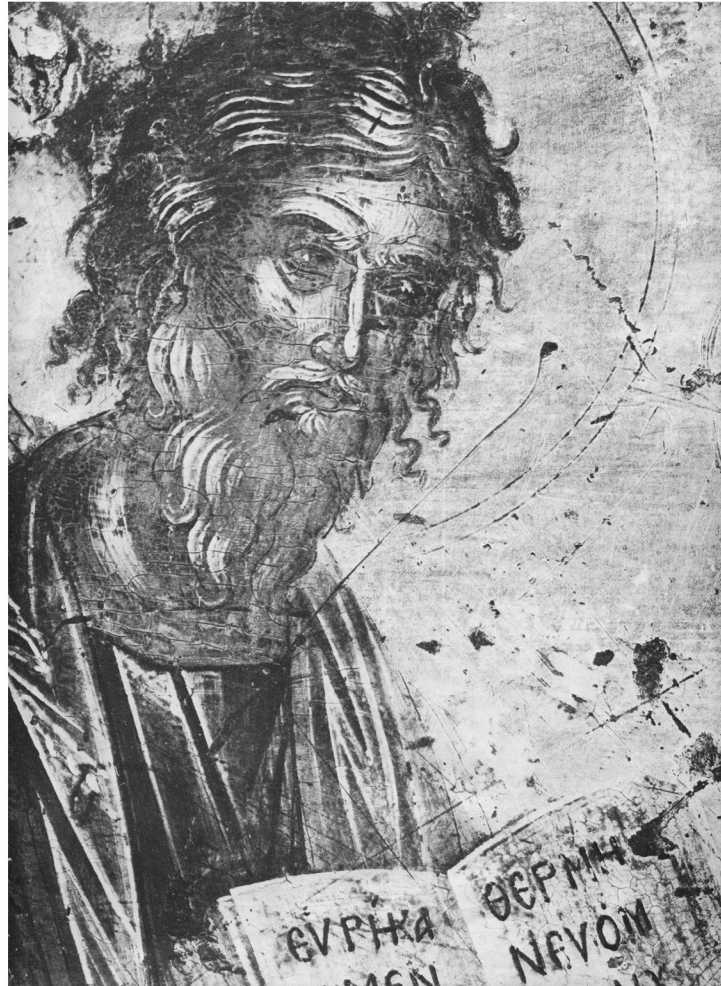
Ο Απόστολος Ανδρέας.

Λεπτομέρεια από την εικόνα: «Η Δέησης μετὰ τοῦ ἁγίου Ἀνδρέου καὶ τῆς ἁγίας Παρασκευῆς».