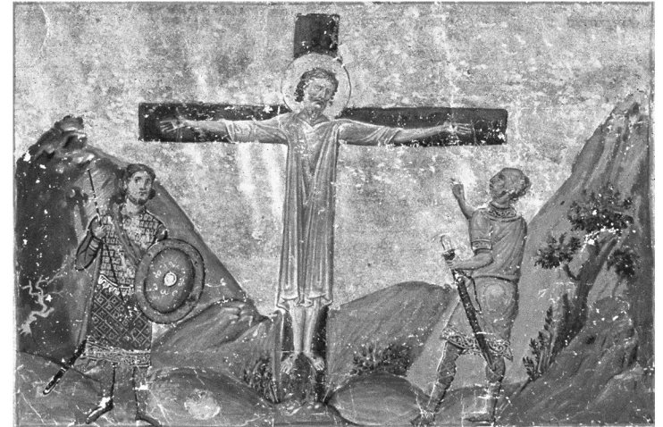
Ὁ Ἀπόστολος Ἀνδρέας ἐπὶ τοῦ σταυροῦ. Μικρογραφία ἀπὸ τὸ «Μηνολόγιον τοῦ Βασιλείου» (Νοεμβρίου Λ'), ἔτους 985 (Βιβλιοθήκη Βατικανοῦ, Ρώμη)

γιογραφικῆς παραδόσεως τοῦ Ἀποστόλου» 8 . Τοῦτος ὁ Βίος εἶναι ὁ κατωτέρω ἐκδιδόμενος.