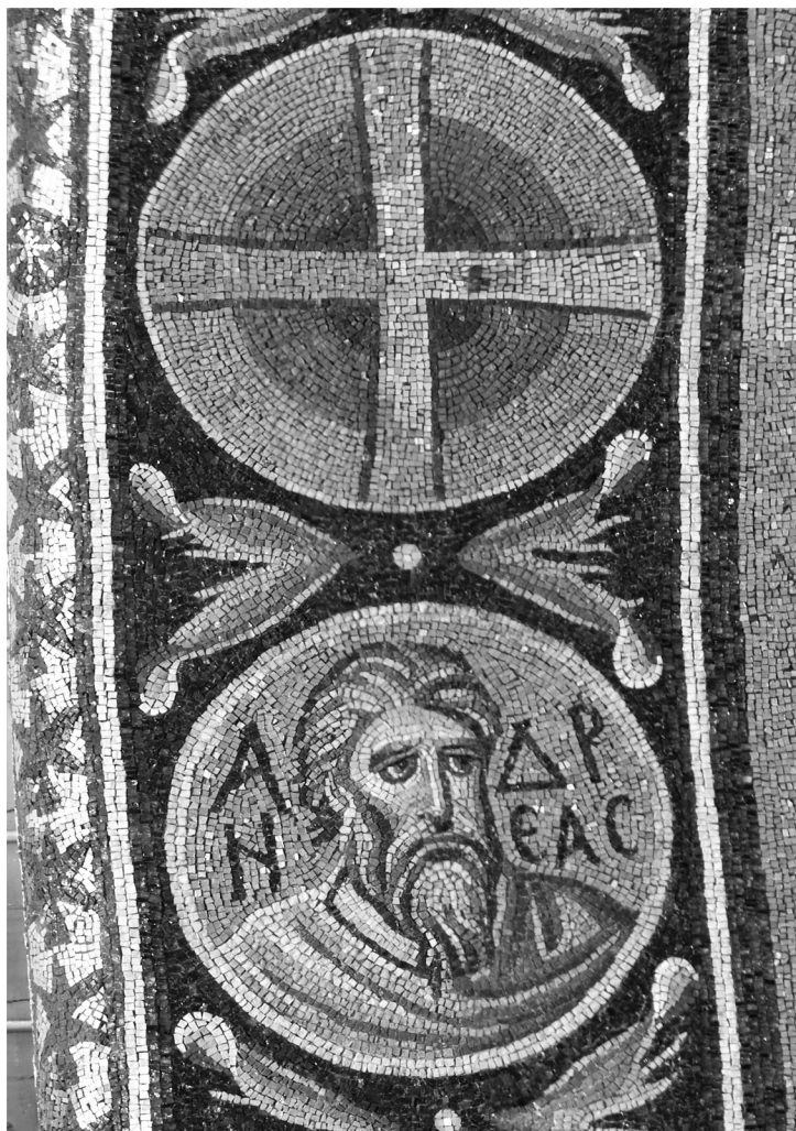
Ψηφιδωτά τοῦ ἀποστόλου Ἀνδρέου: Ἄνω: Εἰς τὴν ἀψίδα τοῦ ἱεροῦ Βήματος τοῦ Καθολικοῦ τῆς Ἱ. Μονῆς Σινᾶ (6 ος αἰ.) Δεξιὰ ἄνω: Εἰς τὴν Ἱ. Μονὴν Παμμακαριστοῦ Κωνσταντινουπόλεως (14 ος αἰ.) Δεξιὰ κάτω: Εἰς τὸν ἱερὸν Ναὸν τοῦ Ἀρχαγγέλου Μιχαὴλ Κιέβου (12 ος αἰ.)