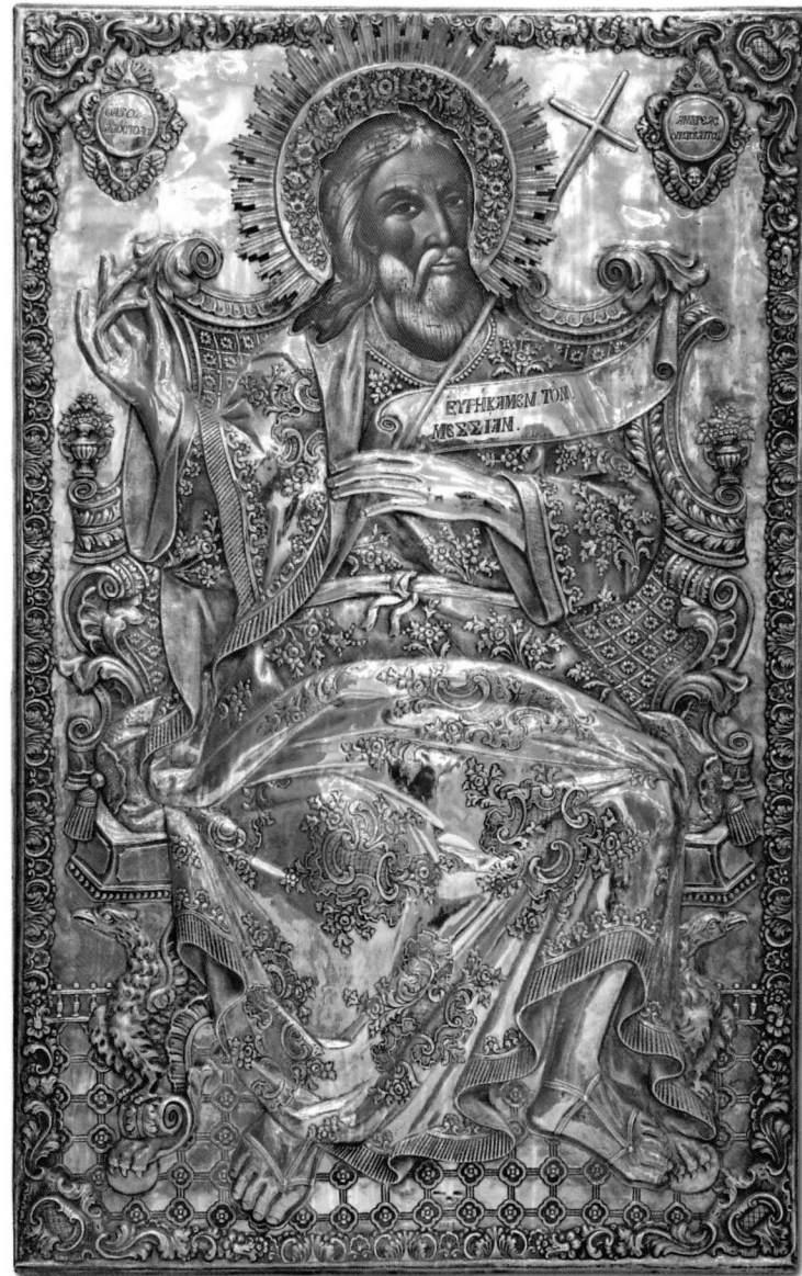
Ἡ ἐφέστιος εἰκὼν τοῦ Πρωτοκλήτου τῶν Ἀποστόλων Ἀνδρέου (1829) εἰς τὸν ἐν Πάτραις ἱερὸν Αὐτοῦ Ναὸν